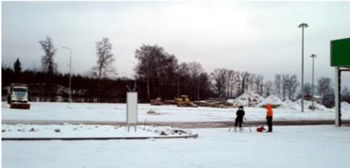
Сторона А (по ходу движения)