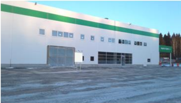
Сторона А (по ходу движения)