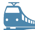
Железнодорожные пути необщего пользования