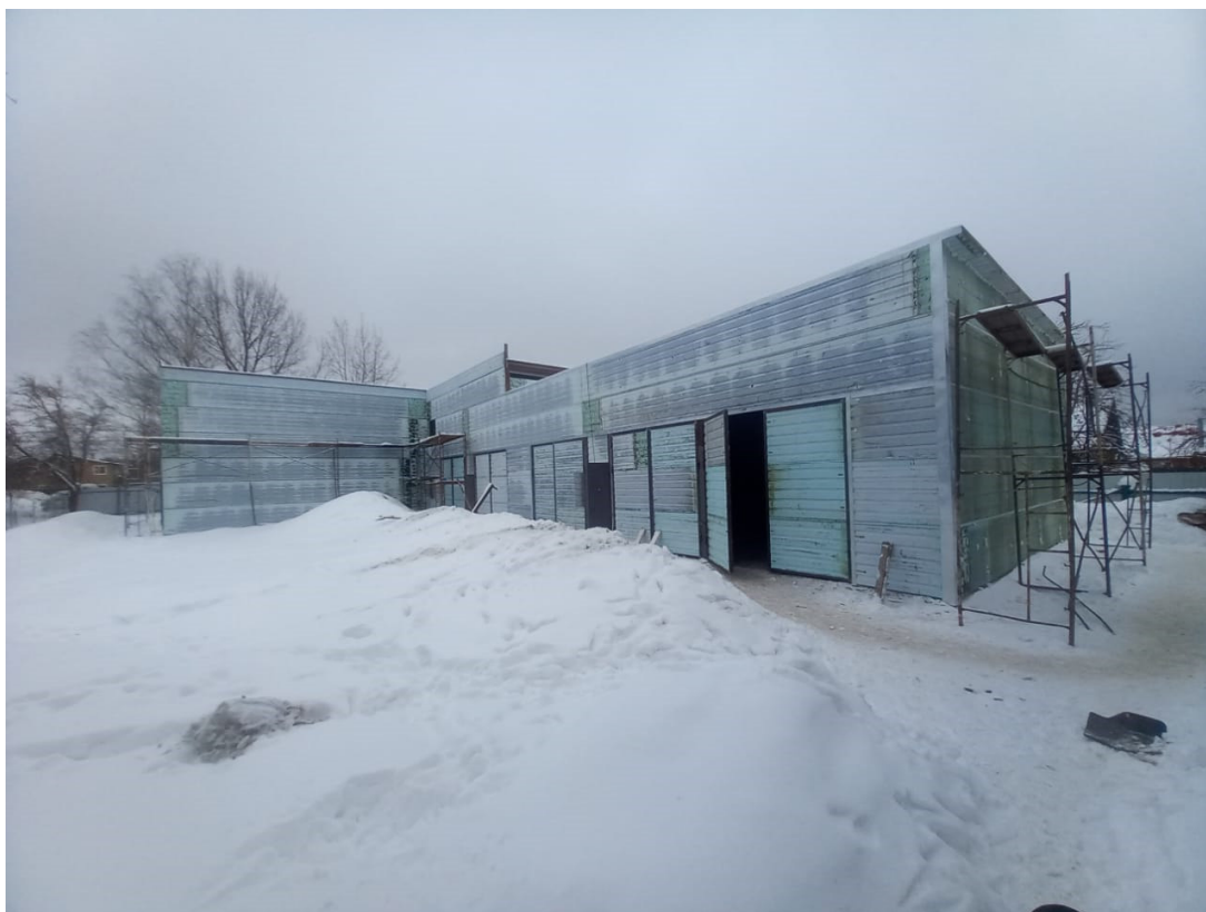
Рисунок 5 – Фотофиксация существующего состояния территории