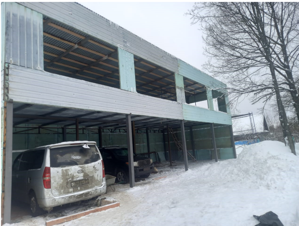
Рисунок 7 – Фотофиксация существующего состояния территории

Земельный участок с кадастровым номером 50:08:0040118:592 имеет категорию земель - «земли населенных пунктов», основной вид разрешенного использования - «Для индивидуального жилищного строительства», площадь – 1000 кв.м.