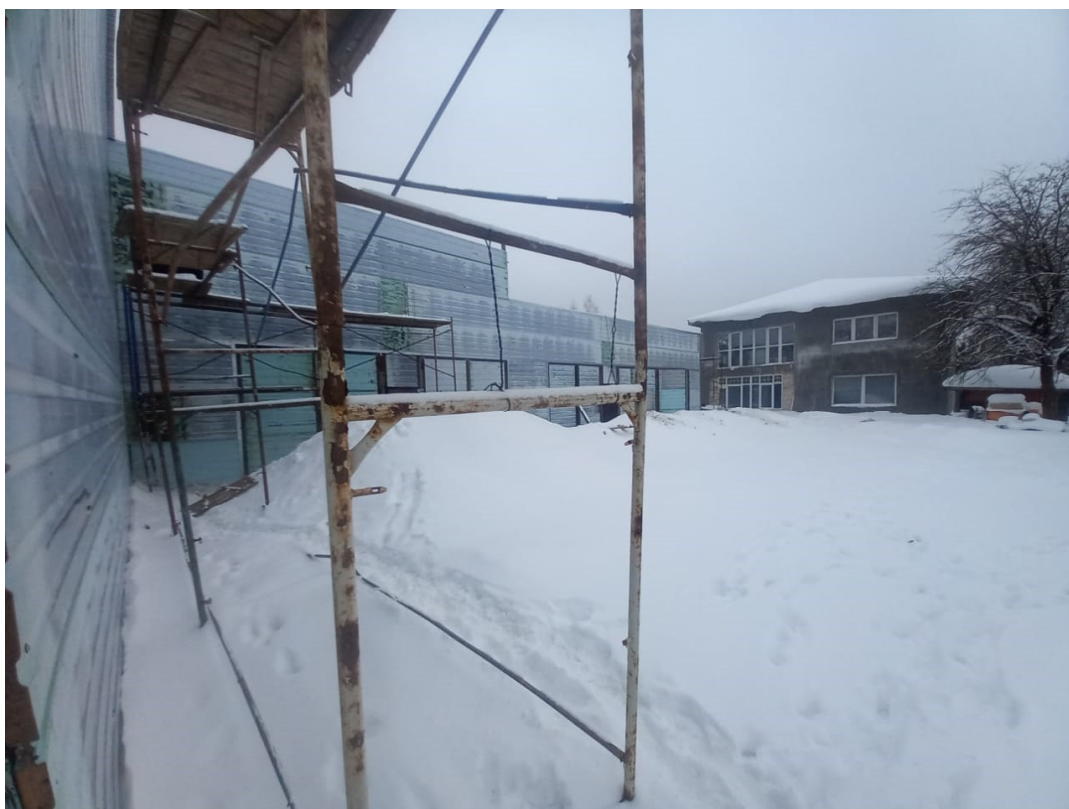
Рисунок 6 – Фотофиксация существующего состояния территории