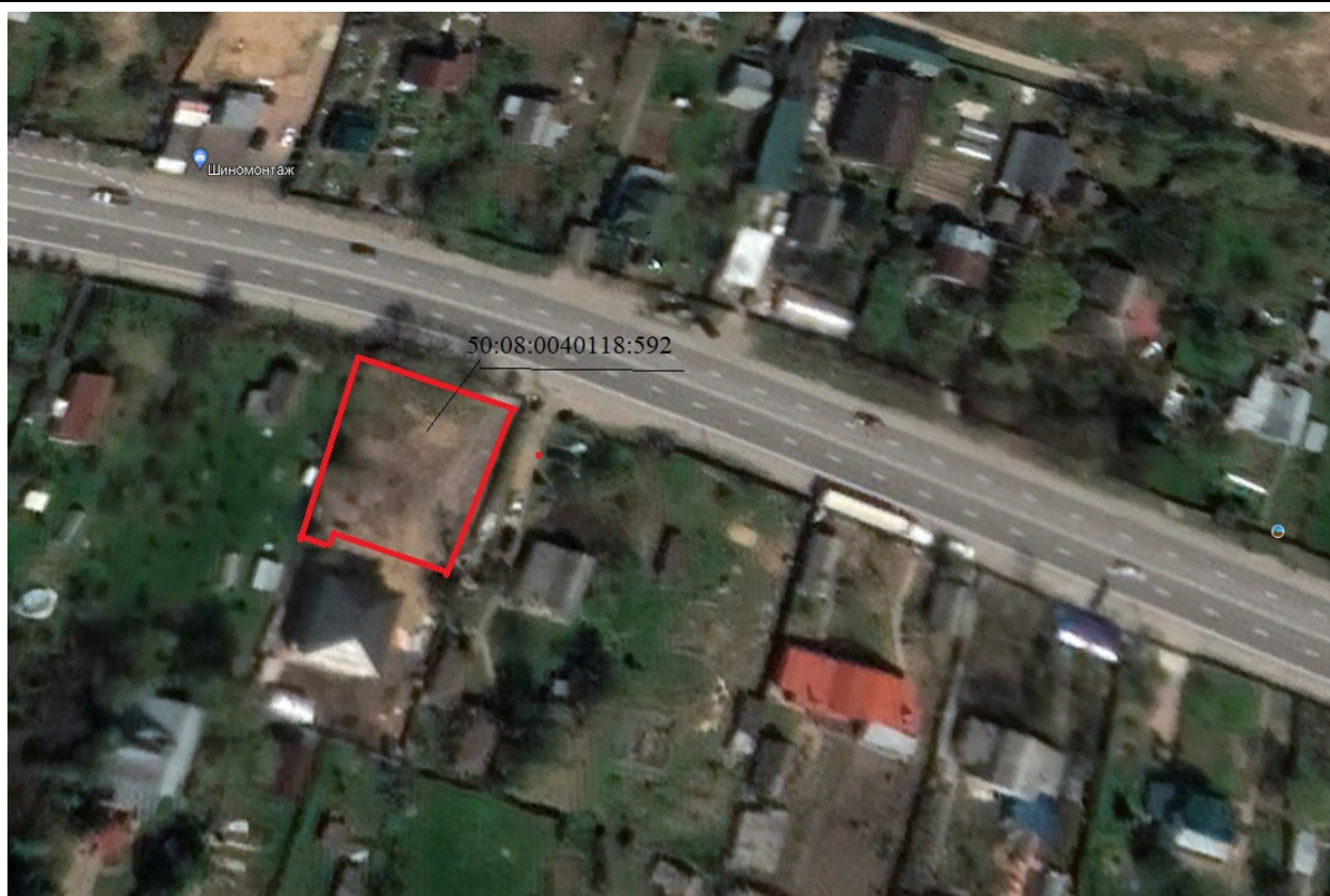
Рисунок 3 – Космоснимок рассматриваемой территории

Фотофиксация существующего состояния территории представлена на рисунках 4,5,6,7