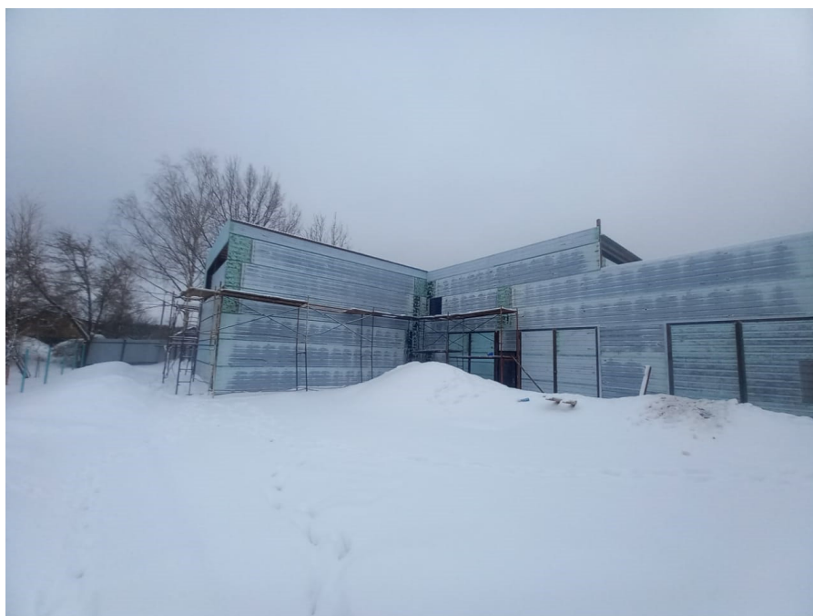
Рисунок 4 – Фотофиксация существующего состояния территории

Фотофиксация существующего состояния территории представлена на рисунках 4,5,6,7